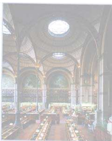
Labrouste, éd. Nicolas Chaudun / GAPA / BnF / MoMA. Salle de lecture de la Bibliothèque nationale.

Après un rappel biographique, sont analysés les projets et constructions que Le Corbusier a conçus dans son pays natal, la Suisse, dont la villa Le Lac (Corciaux, 1923-1924), où est appliqué le principe du plan libre, l'immeuble Clarté (Genève, 1931-1932) qui préfigure des unités d'habitation de plus grande échelle, ou encore le projet